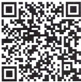
QR CODE สื่อประชาสัมพันธ์